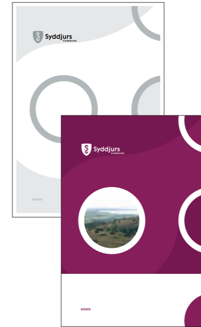
FIG. B: EKSEMPLER PÅ RAPPORTER