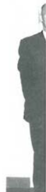
En borgme Formænde var udset i Ebeltoft-ho rådsformæ strikt. Ståe kelsen, Agi Rasmussen. Foto i Ebel