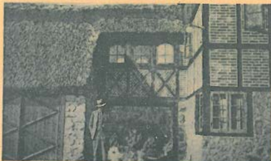
Udhus og vestre Længe, der er forbundet med Svalegang.