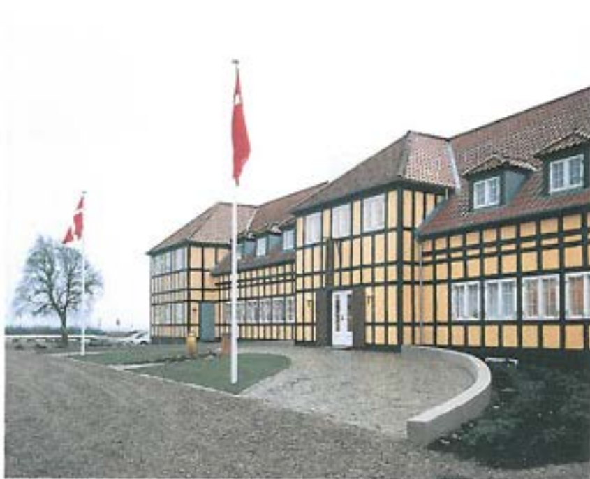
Molskroens nuværende bygninger.

Den 20. januar 1940 nedbrændte kroen til grunden. Den blev herefter genopført i sin nuværende skikkelse. Det er dog næppe EF der har tegnet den nuværende bygning. Den nuværende bygning er på 62 fag i to etager med bindingsværk.