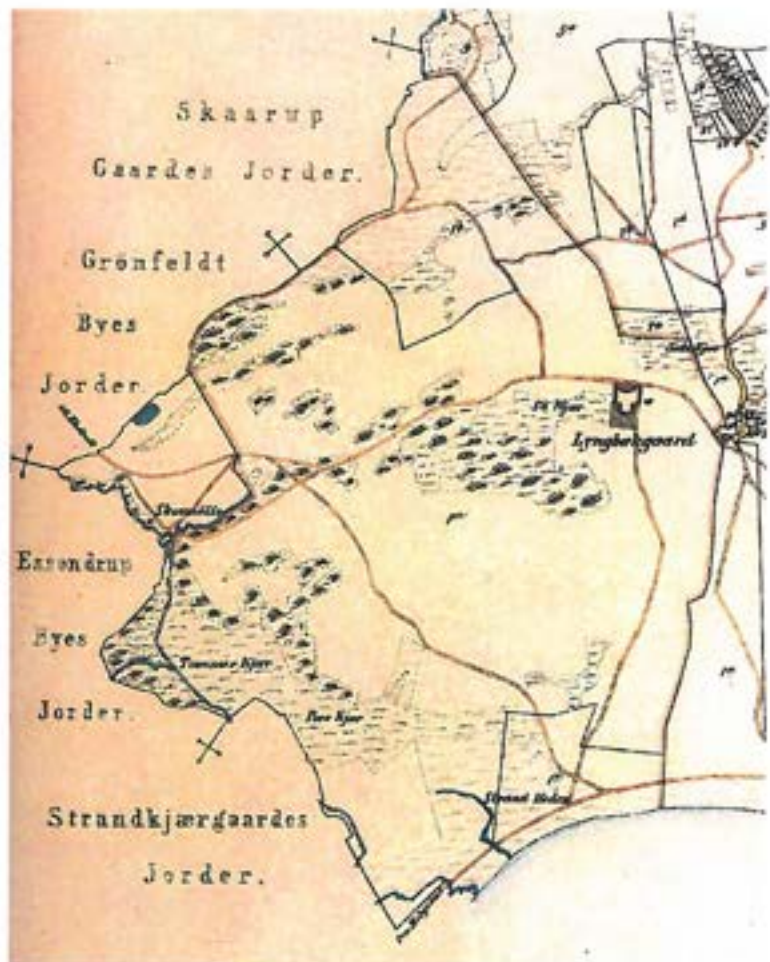
Området omkring Lyngsbæk Strand. Udsnit af Minoreret Sognekort for Dråby Sogn. Trykt omk. 1836.