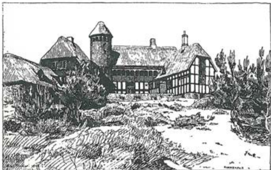
Tegning af Nørrehald udført af Egil Fischer. Efter LM 1998, s. 5