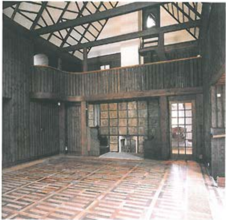
Atelieret Nørrehold. Efter LM 1998, s. 55.