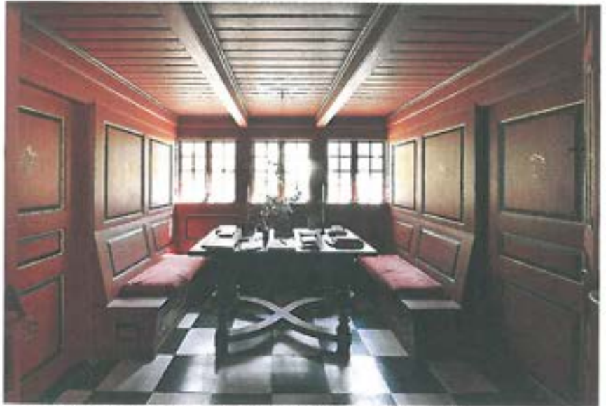
Spisestuen Ellen Dahls sommerhus. Efter LM 2015, s. 51.