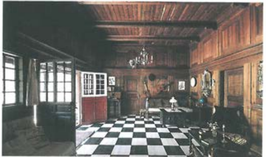
Pejsestuen Ellen Dahls sommerhus. Efter LM 2015, s. 53.