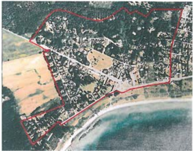
Feriebyens afgrænsning. Efter Kulturmiljøer i Århus Amt. 2004.