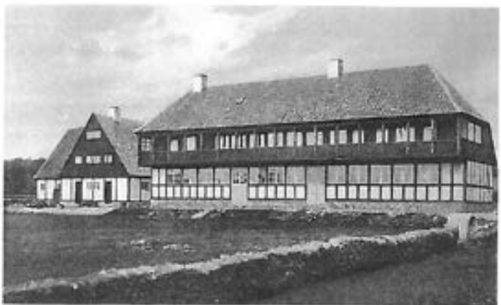
Den oprindelige krobygning. Efter ML 2015, s. 36.