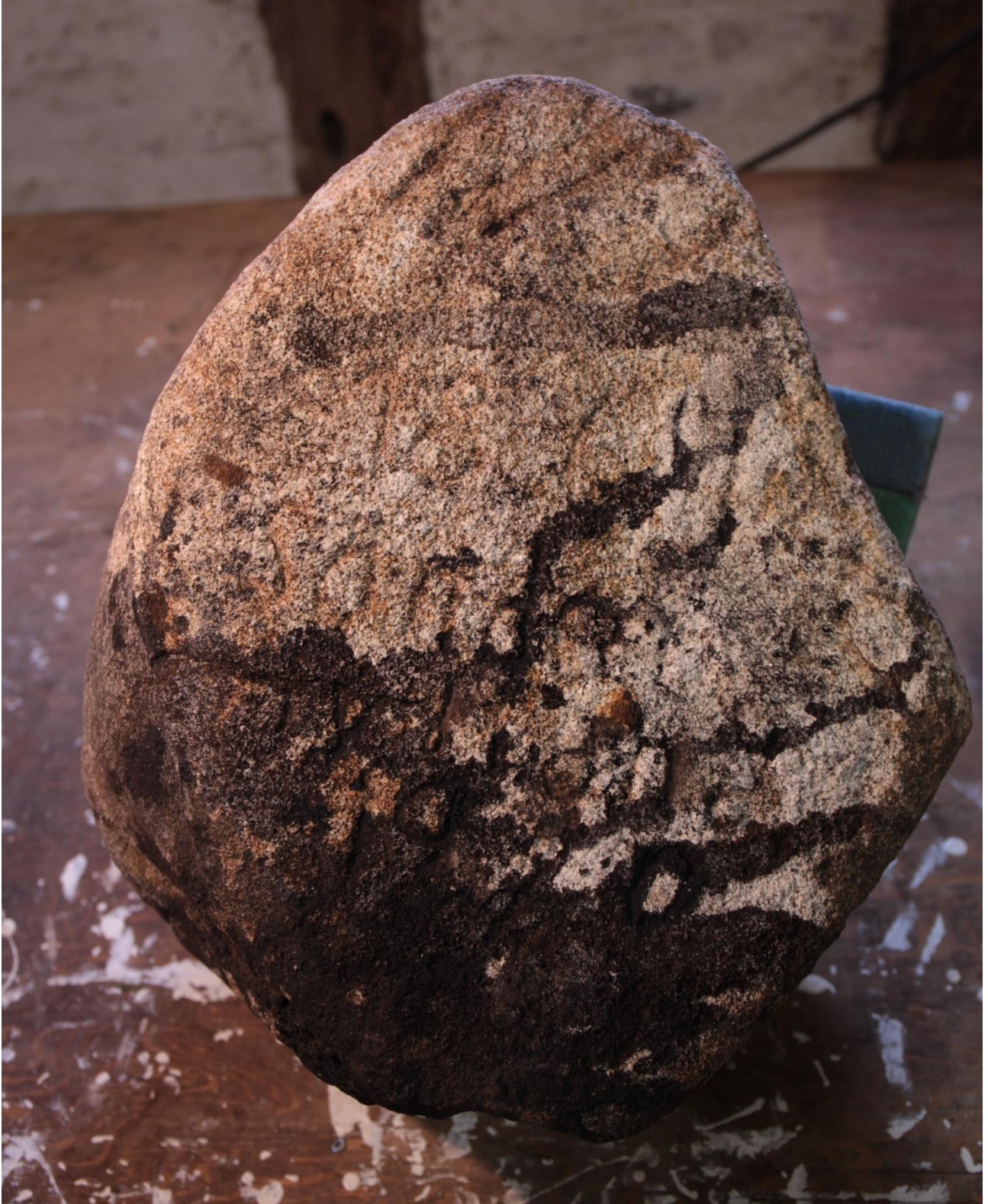
Gl. Mørke-stenen før opmaling, januar 2020